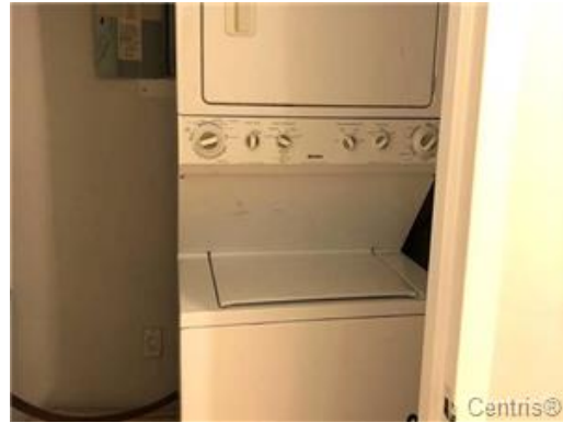
Salle de lavage